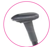
XL Multi Armlehne