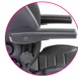
Flip-Up Armlehne inkl. Höhenverstellung