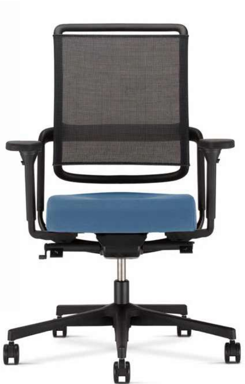
Xenium swivel chair Mesh