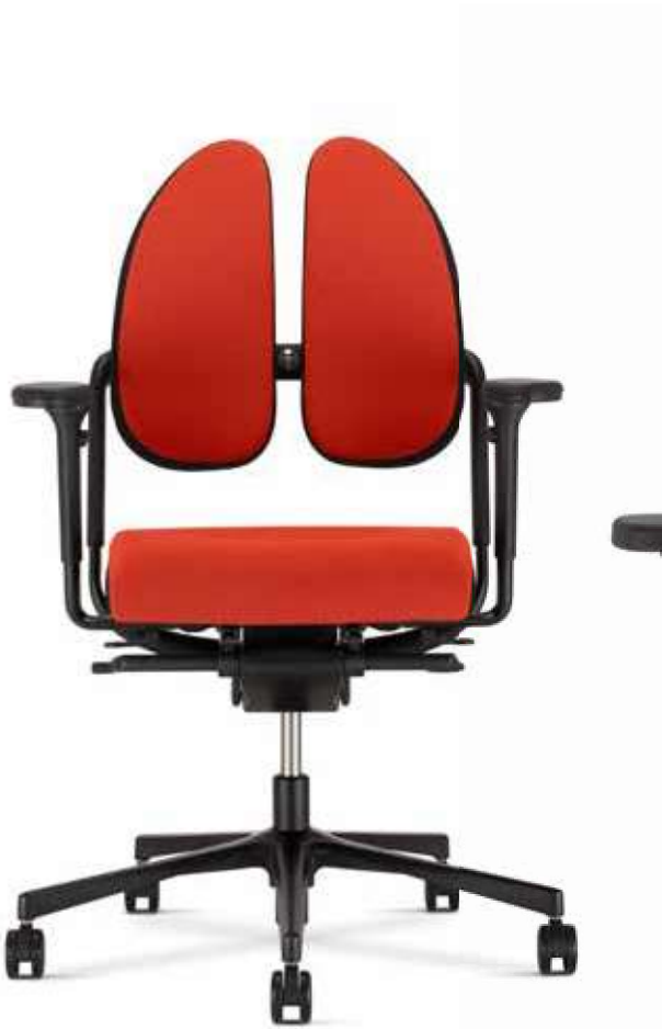
Xenium swivel chair Duo-Back