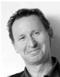
Designed by Martin Ballendat

Ein ansprechendes Design gepaart mit überzeugender Flexibilität sind Eigenschaften, die die Sitzmöbelserie Xenium auszeichnen. Die Stühle passen sich der Körperform des Nutzers optimal an und garantieren so ergonomischen Komfort in jeder Position. Die Stuhlserie Xenium wurde in Funktion und Design für höchste Ansprüche konzipiert.