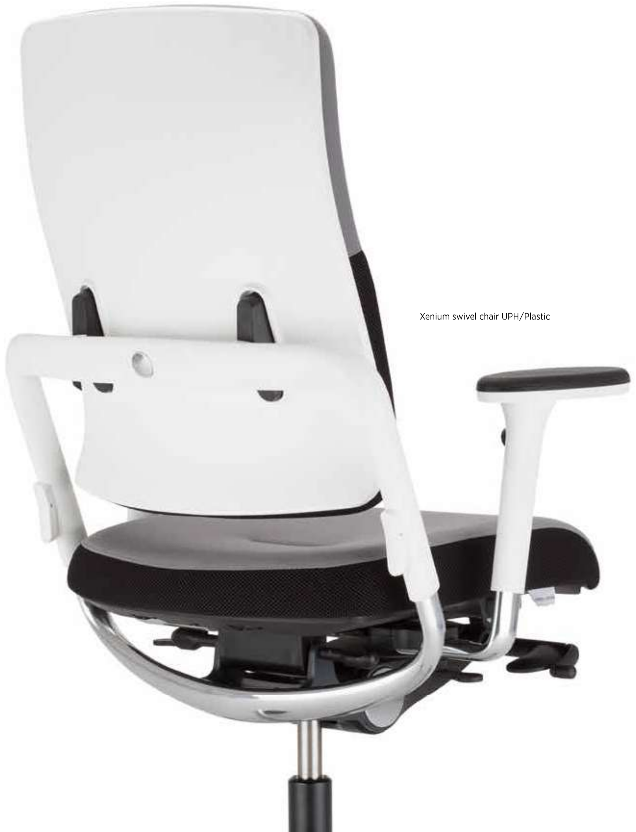
Xenium swivel chair UPH/Plastic

Flexibilität ist eine der wichtigsten Eigenschaften in einem modernen Büro. Die Rückenlehnen der Stuhlserie Xenium sind wahlweise in drei Varianten erhältlich: Duo-Back, UPH/Plastic oder Mesh. Mit dieser breiten Auswahl an Rückenlehnen wird eine individuelle Abstimmung auf den Nutzer und dessen Bedürfnisse für mehr Komfort am Arbeitsplatz ermöglicht. Die Rückenlehnenhöhe kann standardmäßig in einem Bereich von 90 mm eingestellt werden.