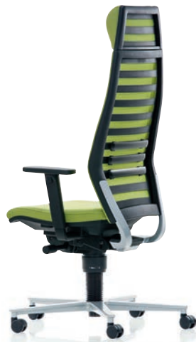
R12 6070 EB PLUS