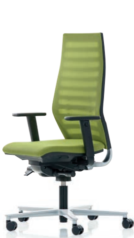
R12 6060 EB