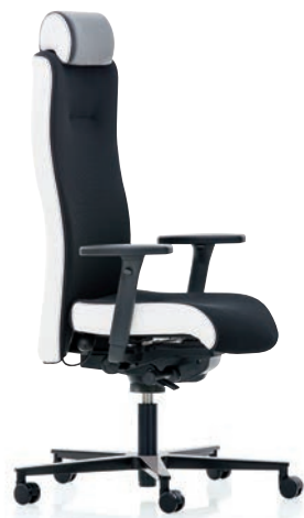
XP 4030 EB