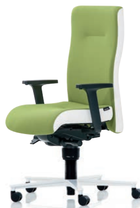
XP 4015 EB PLUS