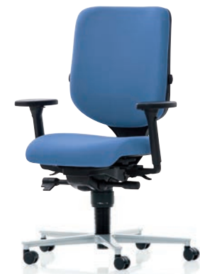
XT 3020 EB PLUS