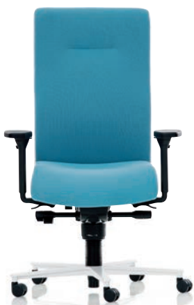
XP 4020 EB PLUS