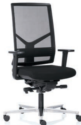
R14 3060 EB