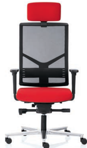
R14 3070 EB