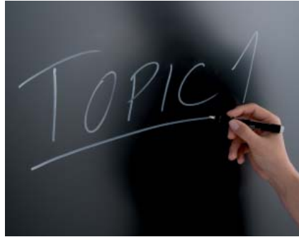
Beschreibbare Monitorscheibe: Das flächenbündige Blackboard ist Teil des Wandsystems.