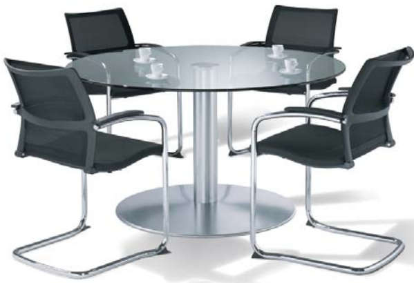
Entscheider-Runde: Auch der runde Besprechungstisch spiegelt die Materialphilosophie des Programms wider.