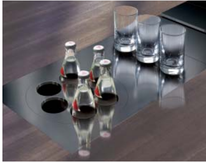
Kühlen Kopf bewahren: Die integrierte Kühlung sorgt für erfrischende Konferenzgetränke – und aufmerksame Teilnehmer.