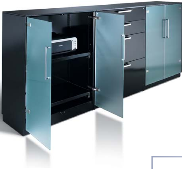
Symbio Sideboard: Satierte Glastüren, Technik, Ausziehböden, Schubladen – alles integriert.

Premio-Konferenzmöbel integrieren mühelos alles, was an moderner Technik zur Verfügung steht – heute und auch in Zukunft. Seien es Steuerungselemente für Präsentationen, Medientechnik in den Schränken oder Monitore im Monotop-Trennwandsystem: Was Kreativität fördert und Meetings erfolgreich macht, findet seinen Platz. Und das Beste: Alles ist leicht und intuitiv zu bedienen!